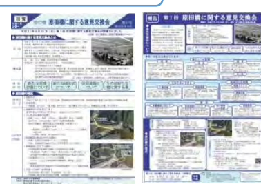
ニュースレター・掲示物の作成