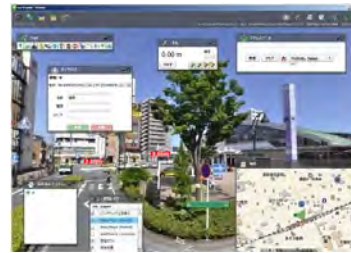
まちの情報の一元管理システム

当NPOが保有するICT技術のまちづくり・むらづくりへの活用について研究し、提案を行っていきます。