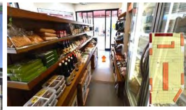
二次元ストリートビュー