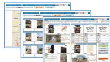
ICTを活用した調査 iPadで作成した帳票