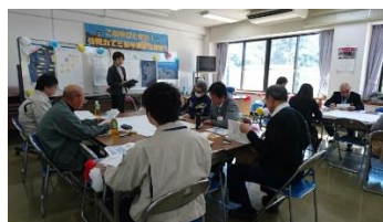
会議の運営支援・ワークショップ企画