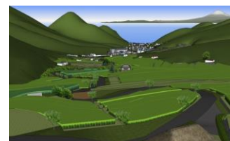
合意形成のための3D空間ツールの活用