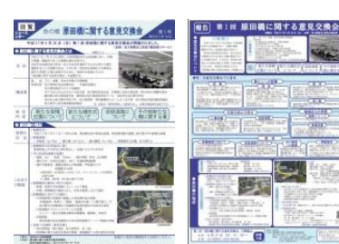
ニュースレター・掲示物の作成